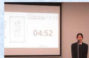
令和5年度開催時の様子