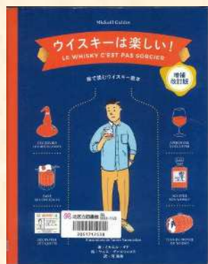
▲『ウイスキーは楽しい!』 ミカエル・ギド/著 ヤニス・ヴァルツィコス/絵 河 清美/訳 パイインターナショナル