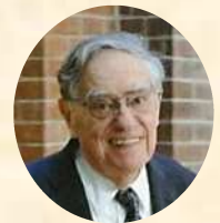
▲ドナルド・キーン氏