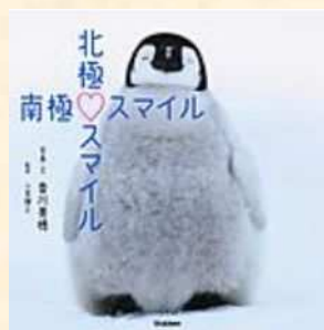
▲『北極スマイル♡南極スマイル』 かがわ みほ 香川美穂/写真・文 こみや てるゆき 小宮 輝之/監修 学研プラス