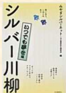
▲『シルバー川柳 いつでも夢を編』 みやぎシルバーネット、河出書房新社編集部/編 河出書房新社