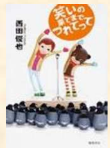
▲『笑いの果てまでつれてって』 にしだ 俊也/著 徳間書店