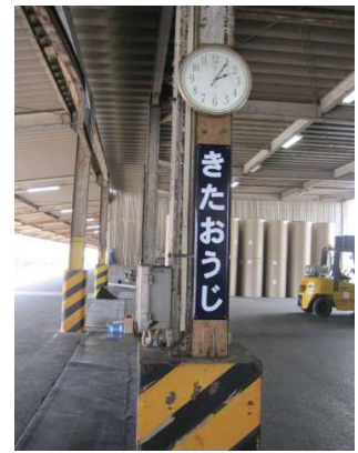
北王子駅（日本製紙物流内）の駅名標

鉄道による貨物輸送は、近代日本の経済成長を支える大動脈でした。しかし、高速道路の整備などモータリゼーションの発展は、鉄道貨物の取扱量を減少させていきました。各主要駅にあった貨物取扱所（貨物駅）は次々に廃止され、コンテナ車とタンク車以外の様々な貨車は、解体もしくは売却されていきました。今回の展示では、時代の波とともに消えた、区内にあった貨物駅について多くの写真を用いてご紹介します。